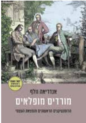
עטיפת הספר

פעלו המשורר נובאליס; הפילוסוף יוהן גוטליב פייכטה; האחים לבית שלגל – פרידריך ואוגוסט וילהלם, שניהם סופרים ומבקרים. היו שם הפילוסוף פרידריך שילר; נג; האחים וילהלם ואלכסנדר פון הומבולדט, הראשון בלשן והשני מדען וחוקר-נוסע; וגם המחזאי פרידריך שילר. ה"נס" שקיבץ אותם במקום אחד הוא אחד הדברים שוולף מנסה לפענח. "מורדים מופלאים" הוא