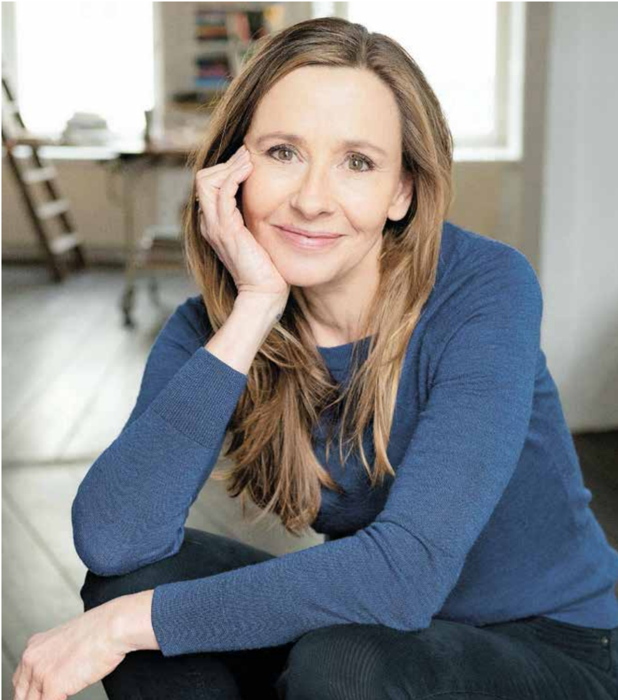
אנדריאה וולף. "מתי התחלנו להיות אנוכיים כפי שאנו כיום?"

המהפכה שחוללו חברי חוג יינה שינתה את אופן חשיבתם של בני האדם עד ימינו. בולטת במיוחד העובדה שחברי הקבוצה ביטלו את החלוקה בין מדעי הרוח למדעים המדויקים. הם חיברו בין שירה ופרוזה לטבע ולאמנות,