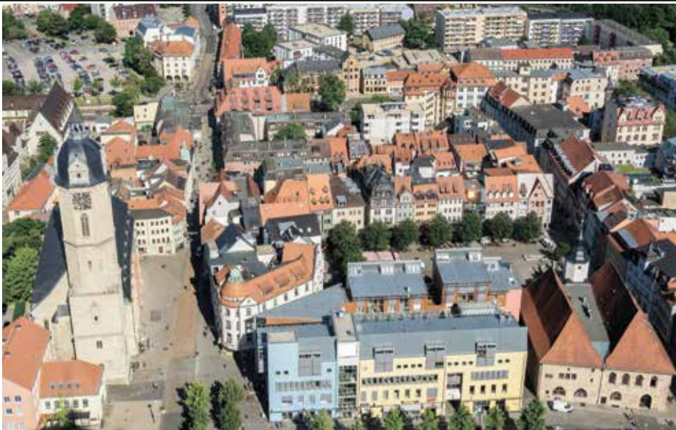
יינה כיום. היתה בה פחות צנזורה מאשר במקומות אחרים

שמרתיבה את הדעת". האם התפתחות הרומנטיקה נושאת מאפיינים גרמניים? "לא בהכרח. יש נסיבות היסטוריות למה זה קרה בגרמניה אבל זה אוניברסלי לחלוטין. התרבות שללהם הן על האנושות, על יחסינו עם הטבע ועם עצמנו. הם טענו שבמרכז עומד הרצון החופשי והיכולת לקבוע את גורלנו. "זה רגע מכריע עבור האנושות. כך עלו שאלות כגון מי אני כאינדיבידואל וכחבר בחברה? איך אוכל לחיות חיים מלאים, להגשים את חלומותי ובכל זאת להיות אדם טוב? איך אפשר ליישב את הרצונות האישיים שלי עם הצרכים של החברה? איך אפשר להיות אדם חופשי ובכל זאת אדם טוב?"